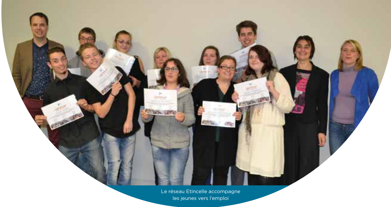
Le réseau Etincelle accompagne les jeunes vers l'emploi