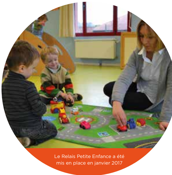
Le Relais Petite Enfance a été mis en place en janvier 2017

Avec 1 000 naissances par an, les besoins en mode de garde sur le territoire sont importants. À travers son Relais Petite Enfance, la Pévèle Carembault vise à devenir une référence pour les jeunes parents et les professionnels du secteur. Elle assure elle-même un service important de Relais d'Assistantes Maternelles (RAM) pour maintenir ce secteur d'activité primordial en