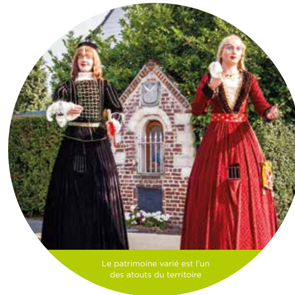
Le patrimoine varié est l'un des atouts du territoire

La Pévèle Carembault se distingue des agglomérations qui l'entourent par le juste équilibre qu'elle présente entre de larges espaces naturels ou agricoles et des éléments bâtis singuliers, plus ou moins discrets mais abondants (fermes, églises, châteaux, maisons traditionnelles ou bourgeoises) autour desquels sont venus se développer villes et villages. L'action communautaire intègre l'importance de préserver et valoriser cet ensemble harmonieux. Les aménagements que la Pévèle Carembault entreprend