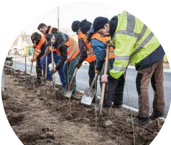
L'Atelier d'insertion entretient les espaces communautaires

La Pévèle Carembault cultive une image de territoire verdoyant. Pour autant, sa qualité environnementale pourrait être largement améliorée et devenir ainsi la vraie plus-value du territoire dans les décennies à venir. Une politique visant à garantir la qualité des espaces naturels et publics doit être mise en œuvre pour faire de cette nécessité une source de développement. Une politique ambitieuse d'entretien et de gestion écologique aura des effets positifs sur la biodiversité, mais également sur la qualité sanitaire des espaces publics et de nos communes. Cette