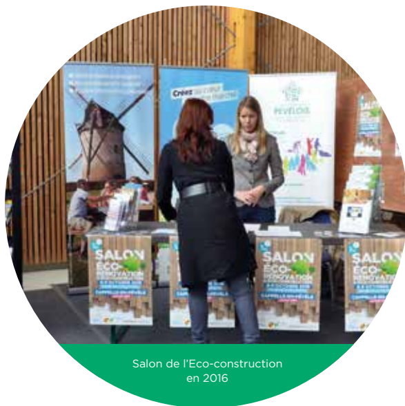
Salon de l'Eco-construction en 2016

Produire autant d'énergies renouvelables que la consommation globale du territoire est le pari ambitieux que se sont fixé les élus communautaires à l'horizon 2036. Pour cela, il convient d'étudier l'ensemble des solutions techniques envisageables (unité de méthanisation, réseaux de chaleur, panneaux solaires), quantifier leur contribution énergétique mais également faire preuve d'imagination. La mobilisation de tous est incontournable : les producteurs et partenaires pour créer de nouvelles sources d'énergie, et les consommateurs publics et privés pour réduire la consommation d'énergie.