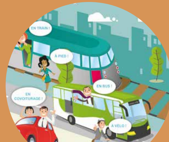
La Pévèle Carembault a été lauréate du Challenge de la mobilité 2016