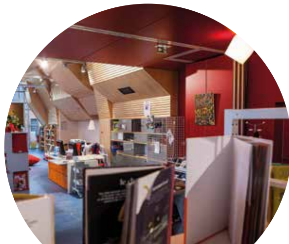
La Pèvèle Carembault compte 34 médiathèques sur son territoire

Avec sa compétence réseau des médiathèques, la Pèvèle Carembault veut développer le rôle de « 3 e lieu » de ces équipements culturels de premier plan. Après le foyer et le travail, les médiathèques ont en effet vocation à accueillir les habitants pour des découvertes, des actions, des animations et des échanges qui dépassent largement le simple emprunt de livres et touchent désormais tous les secteurs. En s'appuyant sur les médiathèques, la Pèvèle Carembault veillera à développer des partenariats en interne, entre ses différents services, pour toucher tous les publics (petite enfance, jeunesse, seniors, économie, environnement...) et avec les acteurs de tous ordres du territoire.