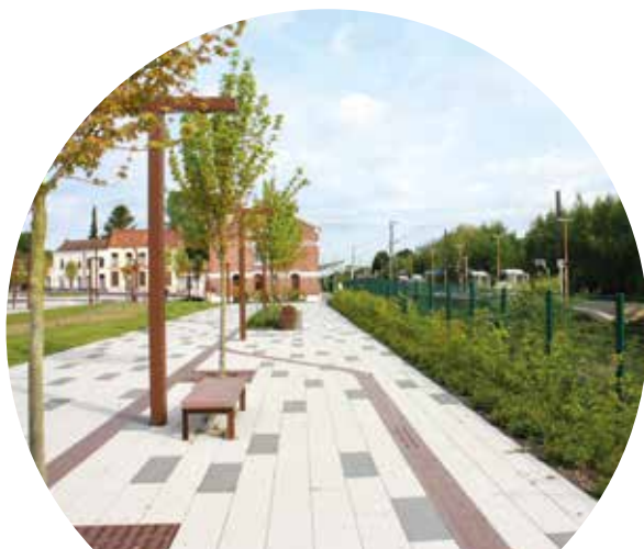
Pôle d'échanges de Templeuve-en-Pévèle

Faciliter l'intermodalité (utiliser différents modes de transport pour un déplacement) est un moyen d'encourager les habitants à utiliser les transports en commun : réseau de bus et TER régional. Pour ce faire, il convient de repenser l'aménagement des gares afin de faciliter leur accès, de faire converger les horaires des différents modes de transport et de proposer des lignes de bus permettant d'acheminer les habitants aux principales gares du territoire : Templeuve-en-Pévèle, Orchies, Phalempin, Ostricourt et celles situées en périphérie (Libercourt et Seclin).